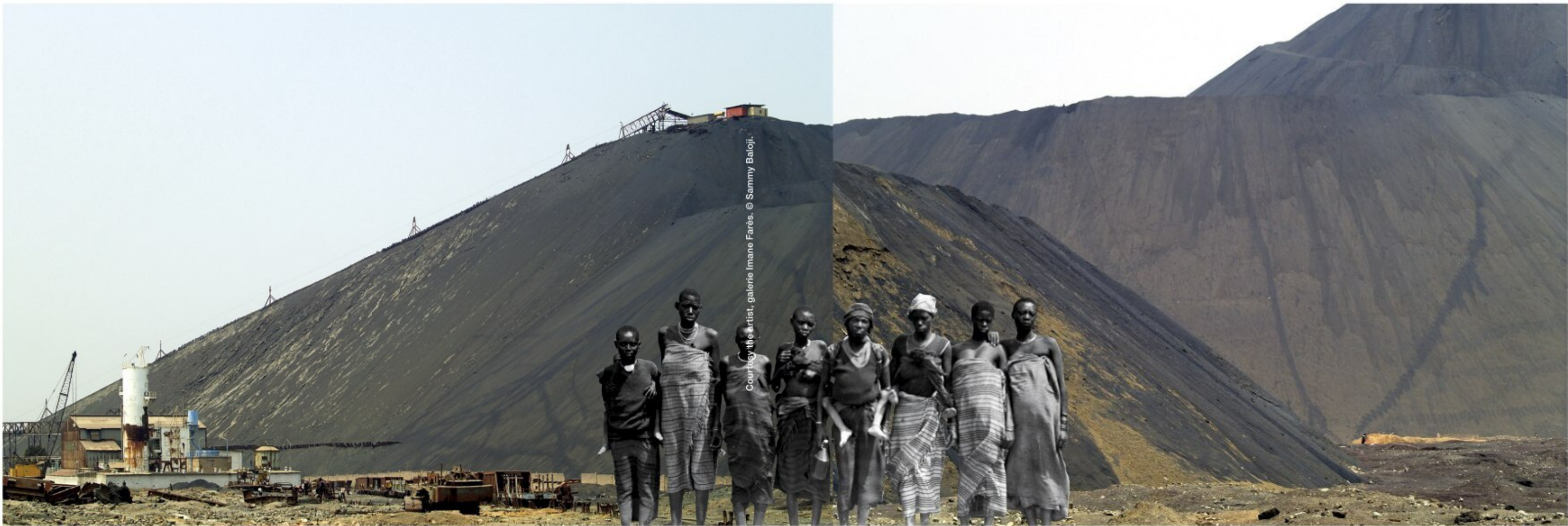
Page précédente : Goods Trades Roots (2020) de Sammy Baloji. Métier à tisser en bois d'Afzélia, 195 x 162 x 12 cm. Réalisé en collaboration avec Estelle Chatelain.