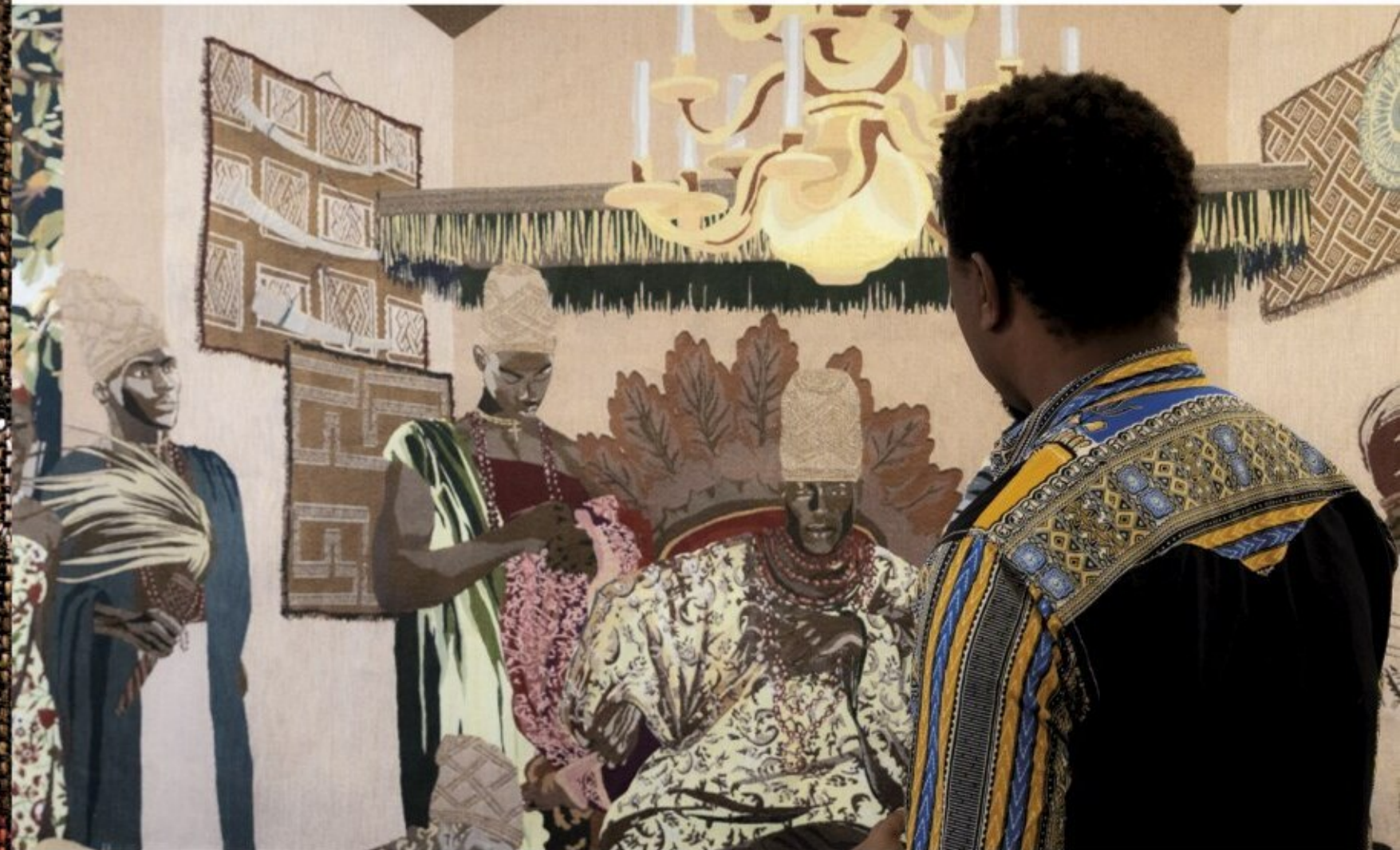
Page de gauche: Rethreaded Indies (détail, 2025) de Sammy Baloji photographié par Delali Ayivi. Laine, coton et lin, 343 cm x 461 cm. Réalisé en collaboration avec Cécile Fromont. Design textile de Silvana de Bari.

Courtesy the artist, galerie Imane Farès.