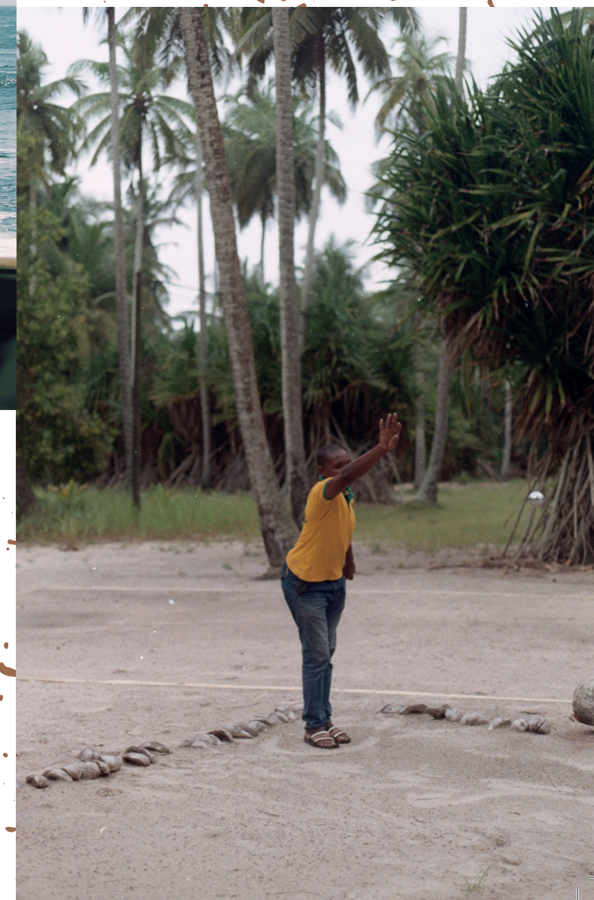
Gravity , Huntington Beach, San Diego, 2018 Motherly , Sénégal, s.d. Points of view , Dakar, Sénégal, 2017 To let go , Assinie-Mafia, Côte d'Ivoire, 2021