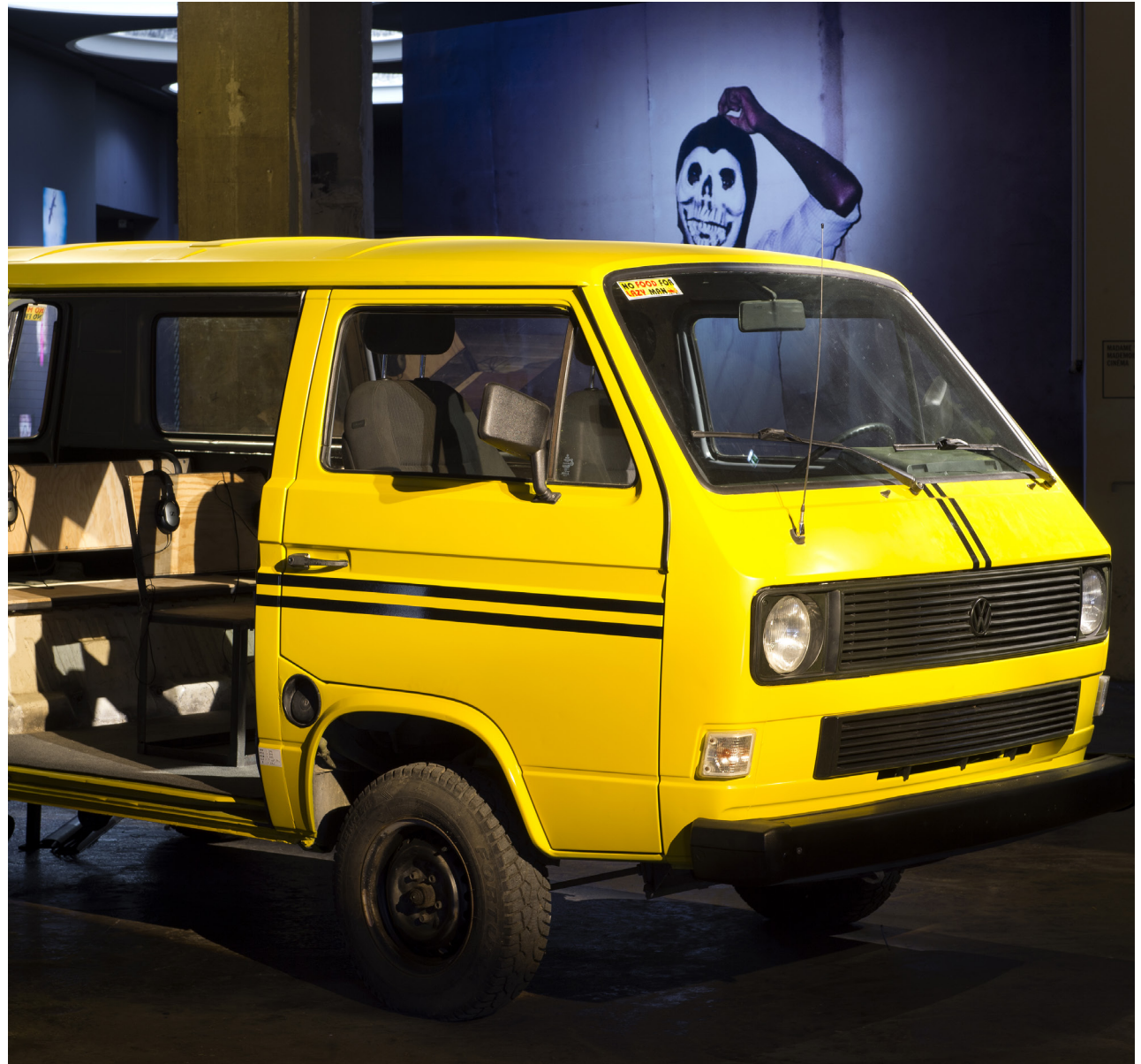
Vue d'installation : Palais de Tokyo, Paris, 2019.

Il est impossible d'imaginer Lagos sans l'un de ses principaux avatars, le « danfo », ce minibus, van, ou vieux combi Volkswagen à seize ou dix-huit sièges, de taille compacte, converti et peint en jaune cadmium avec deux bandes noires. Les danfos relient les points sur la carte d'une mégapole qui semble se déplacer en masse. Apparus sur la scène de Lagos dans les années 1970, ils sont l'archétype du moyen de transport collectif qui permet d'acheminer d'un point à l'autre l'essaim microcosmique de la ville.