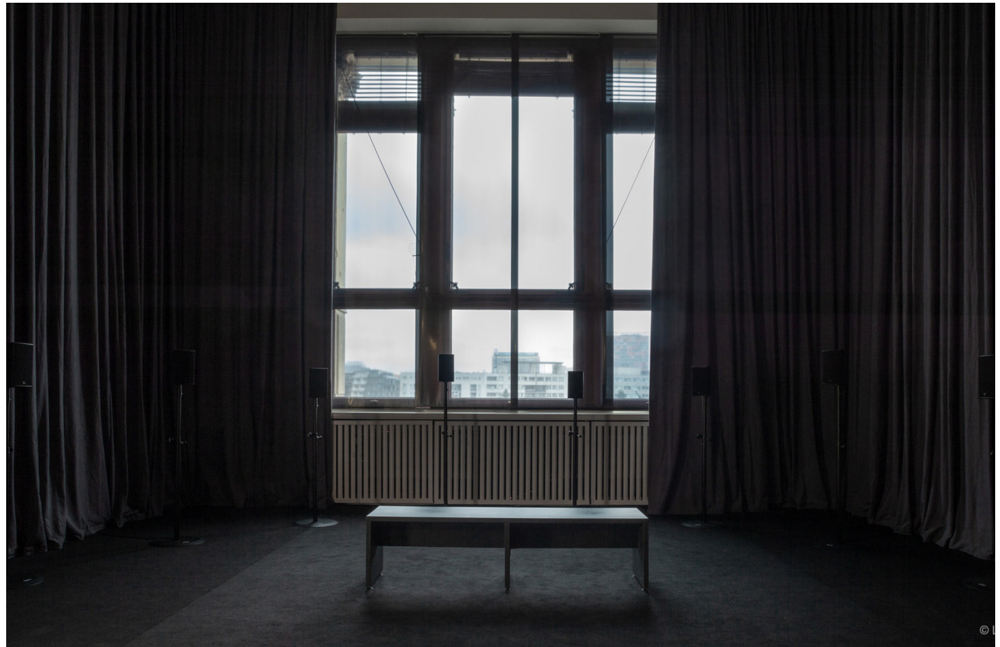
Vue d'installation : Venice Biennale, 2015. © Emeka Ogboh