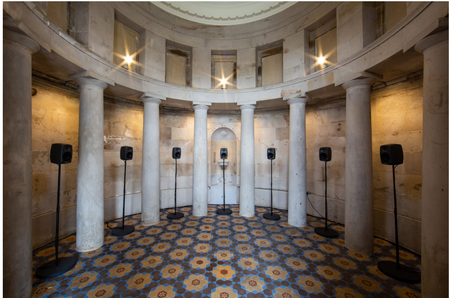
Vue d'installation : The Burns Monument, 2021.

Le Burns Monument a fourni un site résonnant pour l'œuvre, car outre le fait que Robert Burns est le poète national écossais et l'auteur de "Auld Lang Syne", le monument est niché entre deux sites historiques importants : il est adjacent à l'Old Royal High School / New Parliament House, le site original préparé pour accueillir l'Assemblée écossaise après le premier référendum (infructueux) de la nation pour un parlement décentralisé en 1979 ; et il surplombe Holyrood où le Parlement écossais siège aujourd'hui.