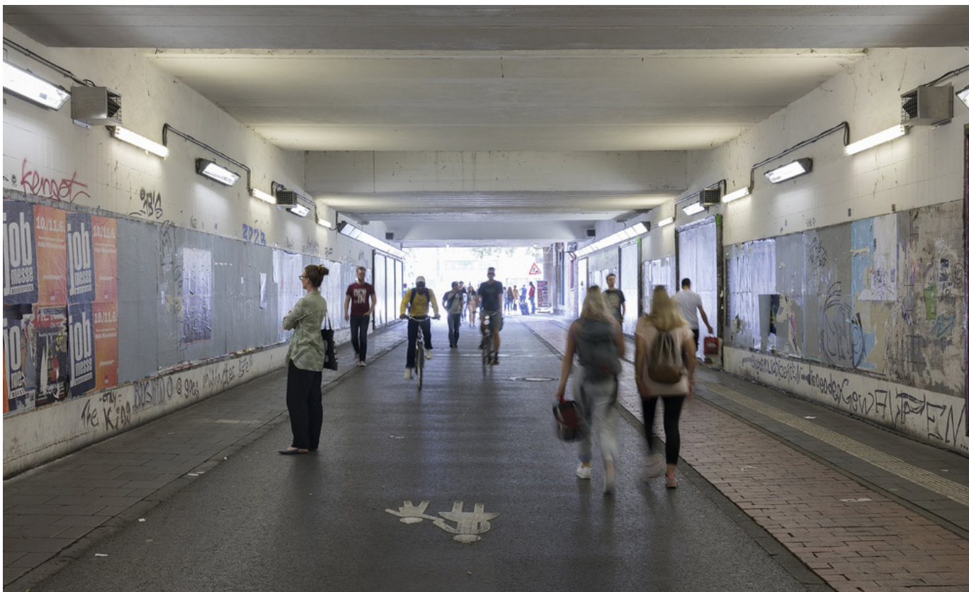
Vue d'installation : tunnel Hamburger (passage souterrain), gare centrale de Münster