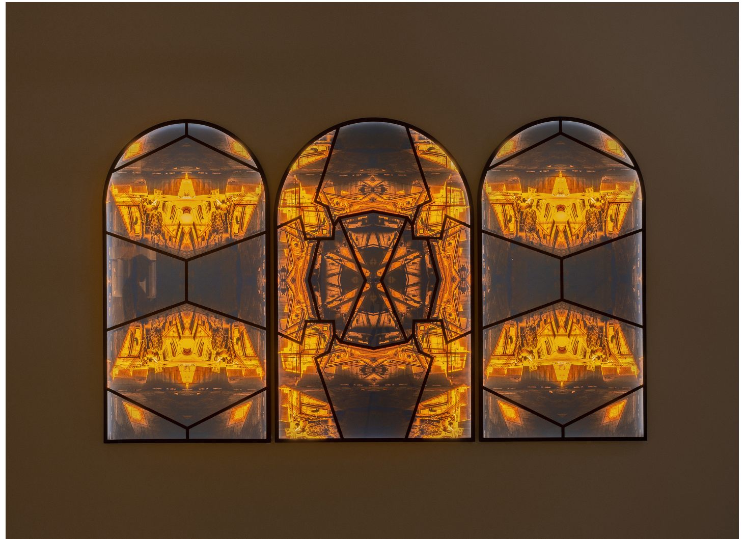
Vue de l'exposition : WIELS, Bruxelles, 2019.

Spirit and Matter est un caisson lumineux monté sur vitrail, prenant la forme d'un triptyque aux tons jaunes. La pièce se distingue par une double bande son, la frénésie de Lagos superposée à l'écho de ce qui ressemble à un sermon dans une église. Le point de départ est une photo d'Ojuelegba, gare routière très animée, qui est aussi un point de convergence et de passage vers la côte d'Afrique occidentale. Autrefois, elle abritait également un temple à la divinité yoruba Eshu. La photographie a été manipulée pour ressembler à un prisme, référence à l'objectif à travers lequel l'artiste ou le spectateur perçoit la ville, depuis sa position à Lagos, Berlin ou ailleurs. Ogboh combine les connotations spirituelles et religieuses yorubas à celles de l'Europe chrétienne, pour obtenir une pièce aux allures de vitrail. L'artiste distingue le physique et le spirituel, mais aussi sa propre errance physique à travers le monde et les pérégrinations mentales qui le ramènent à la mégapole nigériane.