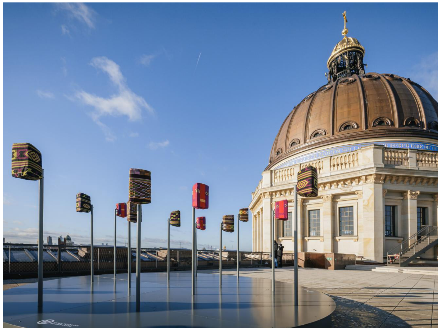
Vue d'installation : Stiftung Humboldt Forum im Berliner Schloss, 2021.

Douze haut-parleurs, recouverts d'akwete, un tissu traditionnel igbo, réunissent les voix individuelles en un chœur de musique chorale qui joue toutes les heures.