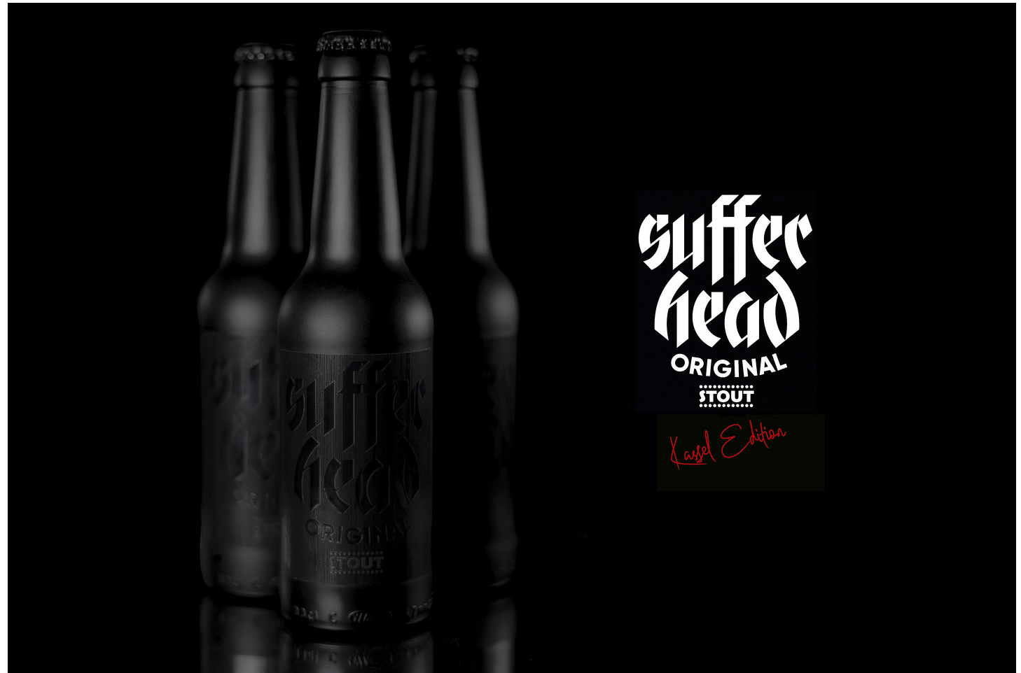
Sufferhead Original (Kassel Edition) , documenta 14, 2017.