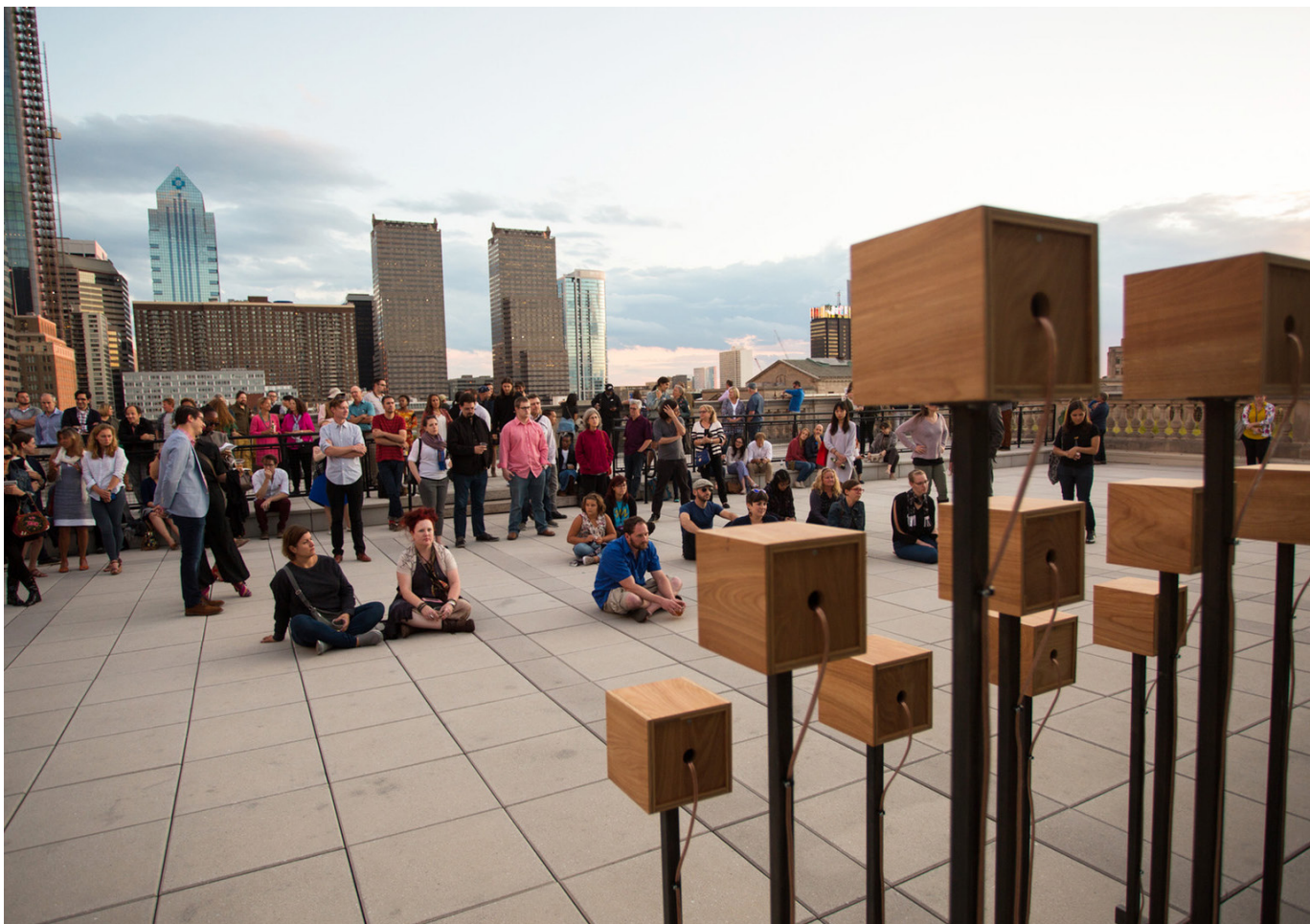
Vue d'installation : Logan Squared, 2017. © Ursula Rucker

En réponse à l'ensemble des données ouvertes des propositions, M. Rucker a composé un poème épique qui a servi de base au projet. Chaque dimanche, les visiteurs étaient invités à faire l'expérience d'une écoute hebdomadaire spéciale d'une installation sonore multicanal sur la Skyline Terrace, au sommet de la branche centrale de la Free Library of Philadelphia's Parkway. La composition comprenait les sons du poème de Rucker et un arrangement choral spécial du "Logan Square at Dusk" de Louis Gesensway, provenant des Four Squares de Philadelphie. Les visiteurs ont également pu entendre le monument sonore grâce à des stations d'écoute fonctionnant à l'énergie solaire autour de la place, où ils pouvaient brancher leurs écouteurs.