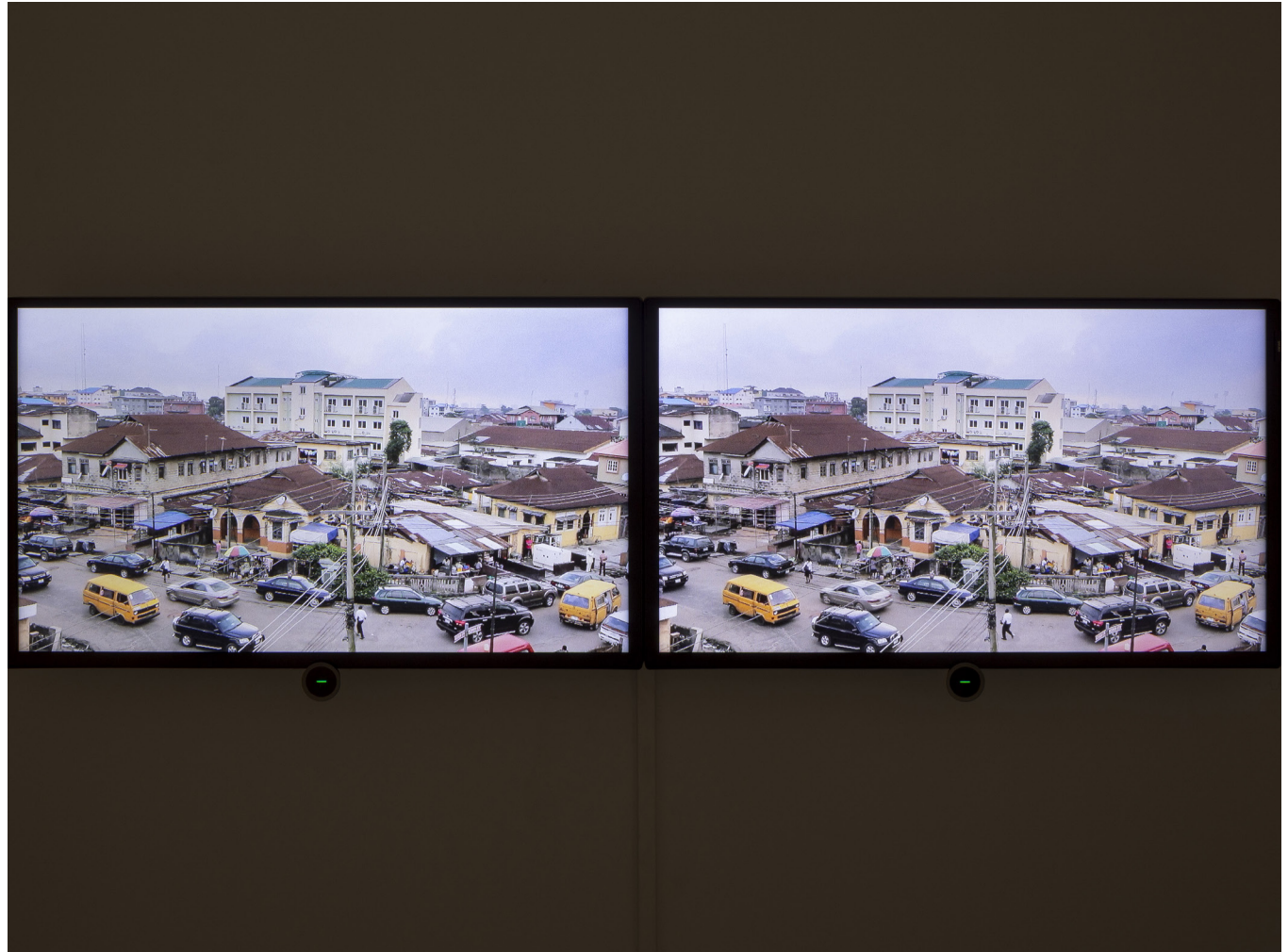
Vue de l'exposition : Galerie Imane Farès, Paris, 2018.