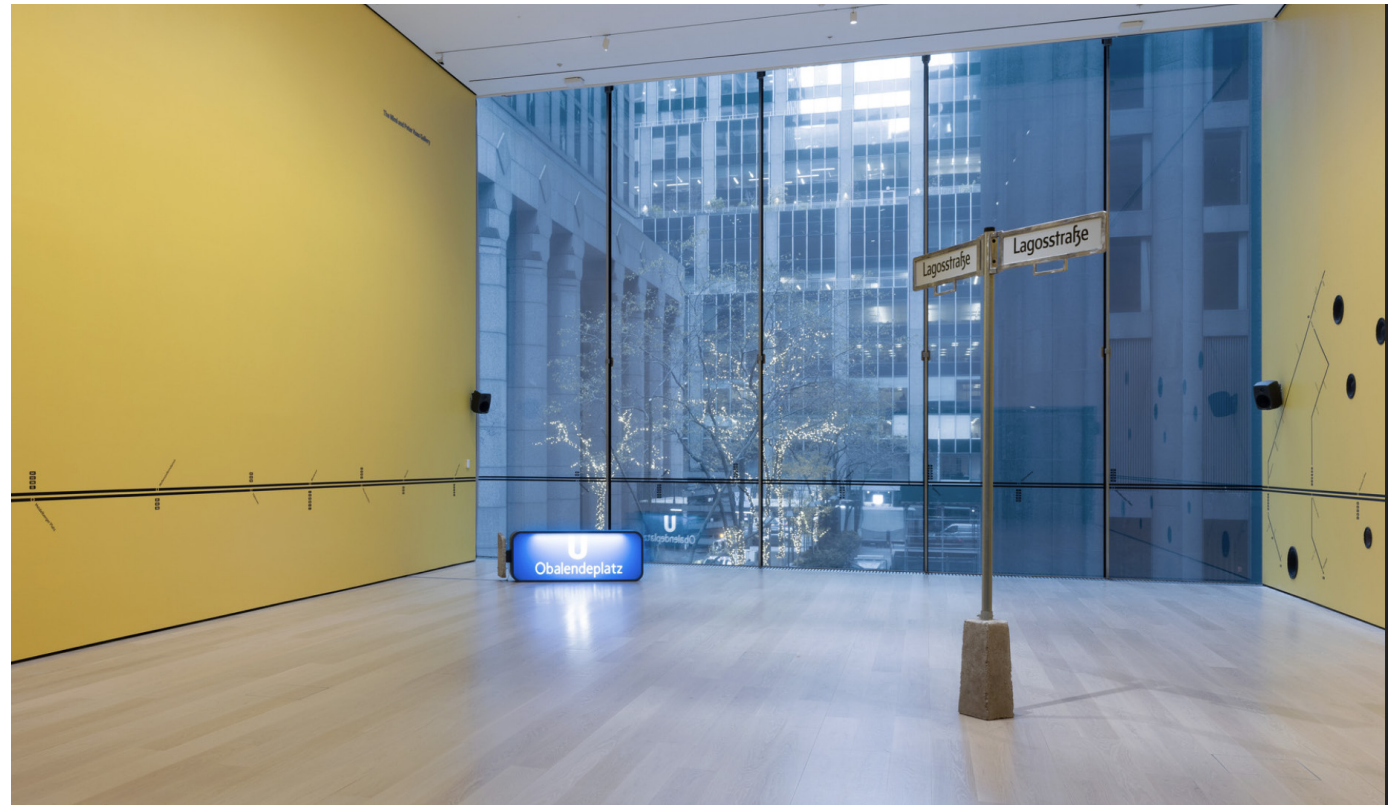
Vue d'installation : MoMA, Nyc, 2022.

L'installation Lagos State of Mind III d'Emeka Ogboh invite les spectateurs dans un monde hybride, mêlant les perspectives de Lagos et de Berlin — deux villes que l'artiste a appelées « chez lui ». L'œuvre présente un paysage sonore composé d'enregistrements de terrain collectés sur une décennie, capturant les sons du quotidien dans les deux villes : klaxons, bruits de moteurs, musiques de rue, annonces des trains berlinois, et conversations d'expatriés africains s'exprimant en allemand débutant. Ce collage auditif explore la manière dont la mémoire collective et les histoires mondiales sont transmises et conservées par le son. Par ailleurs, une carte de transport fictive affichée sur les murs réinvente le réseau de transports publics berlinois en l'étendant jusqu'à Lagos, créant un dialogue visuel et sonore qui reflète l'expérience entrelacée d'un immigrant naviguant entre deux cultures.