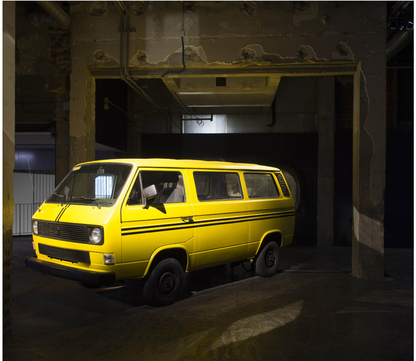
Vue d'installation : Palais de Tokyo, Paris, 2019.

La popularité constante des danfos à Lagos est due à leur bas prix et à l'agilité avec laquelle ils pénètrent tous les recoins de la ville, doublant virtuellement toutes les lignes de bus de Lagos. Le danfo transporte l'esprit et l'âme de Lagos, la mégapole; son effervescence, son élasticité et son esprit indomptable, sa culture multilingue et ses ethnicités, son côté « jamais dire jamais ». Le bus danfo incarne et exprime tout ce qui « fait » Lagos, en entraînant la population de la ville dans son dédale de routes. Une fois dans le danfo, il sera inévitable de faire l'expérience des perspectives multiples de Lagos, avec tout ce que l'on associe à ce mode de transport. Extrait de son contexte, un danfo ne sera qu'un bus jaune avec deux bandes noires, jusqu'au moment où l'on goûtera à sa composition inégalable de sons: des klaxons qui retentissent, des contrôleurs qui annoncent leurs itinéraires en criant, des mix proposés en roulant par des chauffeurs, DJs, des vendeurs et vendeuses van tant leurs produits miracle à tue-tête, des passagers qui échangent les derniers ragots, les colporteurs et leur petit mercantilisme à gogo, les railleries tribales, les dialogues, les monologues au téléphone portable, tout aussi bien que les colères religieuses – tout cela enfermé dans cet espace grouillant de vie. Les vibrations de la ville inondent ce théâtre mobile entre drame et divertissement, presque 24 heures sur 24.