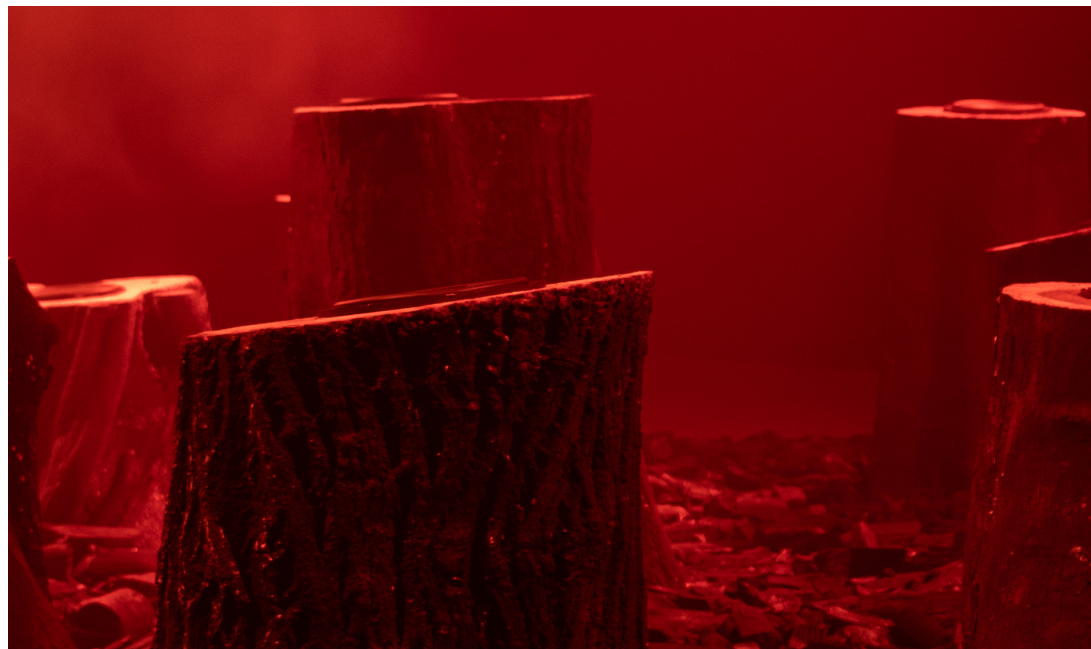
Vue d'installation : Bienal de São Paulo, 2025.