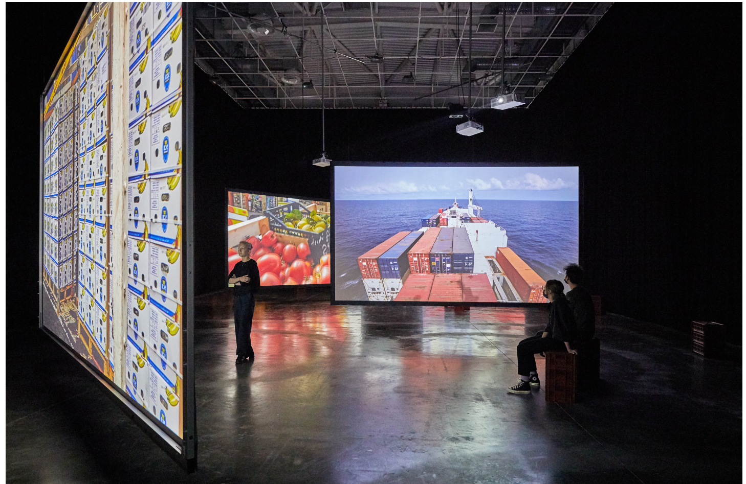
Vue d'installation : La Friche Belle de Mai, 2021.

Le toit de la Friche est investi par Emeka Ogboh comme une plateforme des possibles, investie dans la continuité de l'exposition par des formes artistiques et des moments culturels étendus : invitation de chefs nigériens du Nigéria, du Bénin et du Cameroun, installation, programme musical, etc. Ces différents moments et invitations au public sont spécifiquement pensés pour le lieu et composent une proposition globale où l'hospitalité est mise en avant. Un livre de recettes issues de ces différentes rencontres est publié et constitue la mémoire du projet.