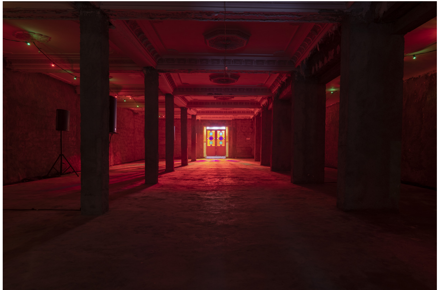
Vue d'installation : DaDa, Marrakech, 2019.

Pour DaDa, il crée un paysage sonore qui témoigne de l'énergie des marchés, de la dynamique et de l'évolution des flux d'activité au cours d'une même journée. Il inclut l'appel à la prière qui ponctue le temps, la musique de rue, les voix des vendeurs, des prêcheurs, des colporteurs, les sons et l'animation des charmeurs de serpents, les klaxons des voitures et le vrombissement des moteurs. L'installation LOS-RAK est une invitation à vivre l'expérience de l'écoute, de sentir le bouillonnement et la ferveur des villes d'Afrique nées du post-colonialisme, des villes qui ont créé leurs propres symphonies acoustiques.