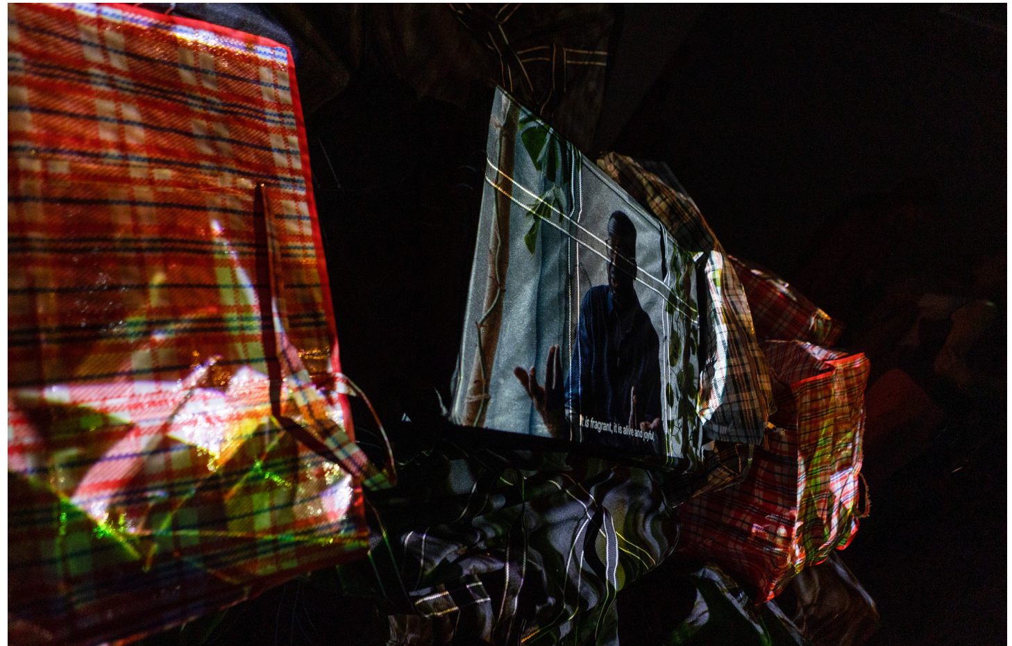
Vue d'installation : galerie Something, Abidjan, 2024.

Grâce à des installations immersives multicanaux, ABJ transmet au public l'énergie d'Abidjan, mettant en lumière son évolution en tant que creuset multiculturel, façonné par la migration, la créativité et la résilience.