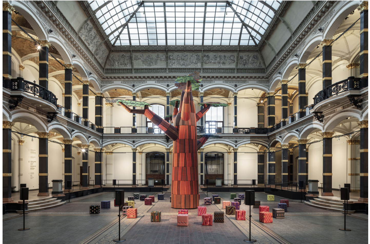
Vue d'installation : Gropius Bau, 2019.

Le point de départ de l'œuvre est le rôle social de l'atrium du Cleveland Museum of Art, utilisé par les visiteurs comme un lieu de rencontre et d'échange, où l'on peut manger et boire, travailler et se détendre. Ogboh décrit l'atrium comme "le cœur et l'âme du musée" et le compare à l'ámà-ou place du village, la force centrale de la vie des Igbo dans le sud-est du Nigeria où il est né. "Les deux sites", explique Ogboh, "sont des zones de contact, des espaces de rassemblement et d'activités rituelles dans leur cadre respectif".