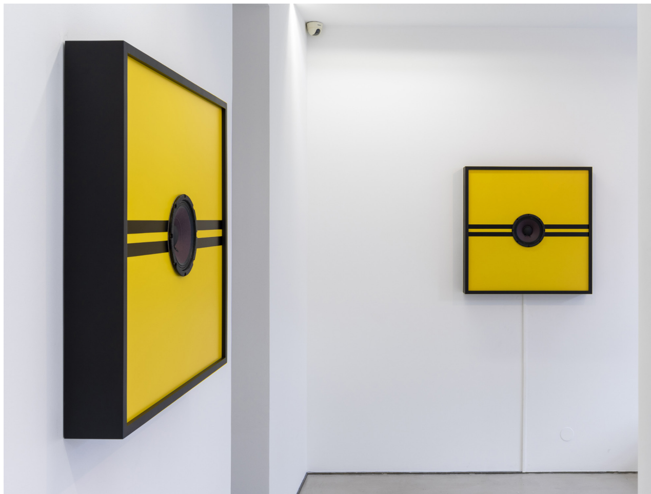
Vue de l'exposition : Galerie Imane Farès, Paris, 2018.