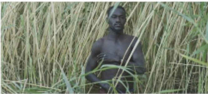
< Cherris Film »The Dam« erzählt vom Überwinden der Angst vor dem Wasser LE BARRAGE, 2022, FILMSTILLS