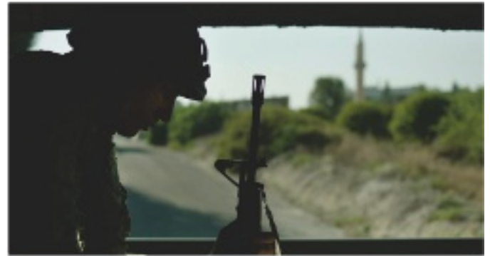
∨ Im Film »The Watchman« bewacht ein Soldat eine umkämpfte Grenze THE WATCHMAN, 2023, FILMSTILLS